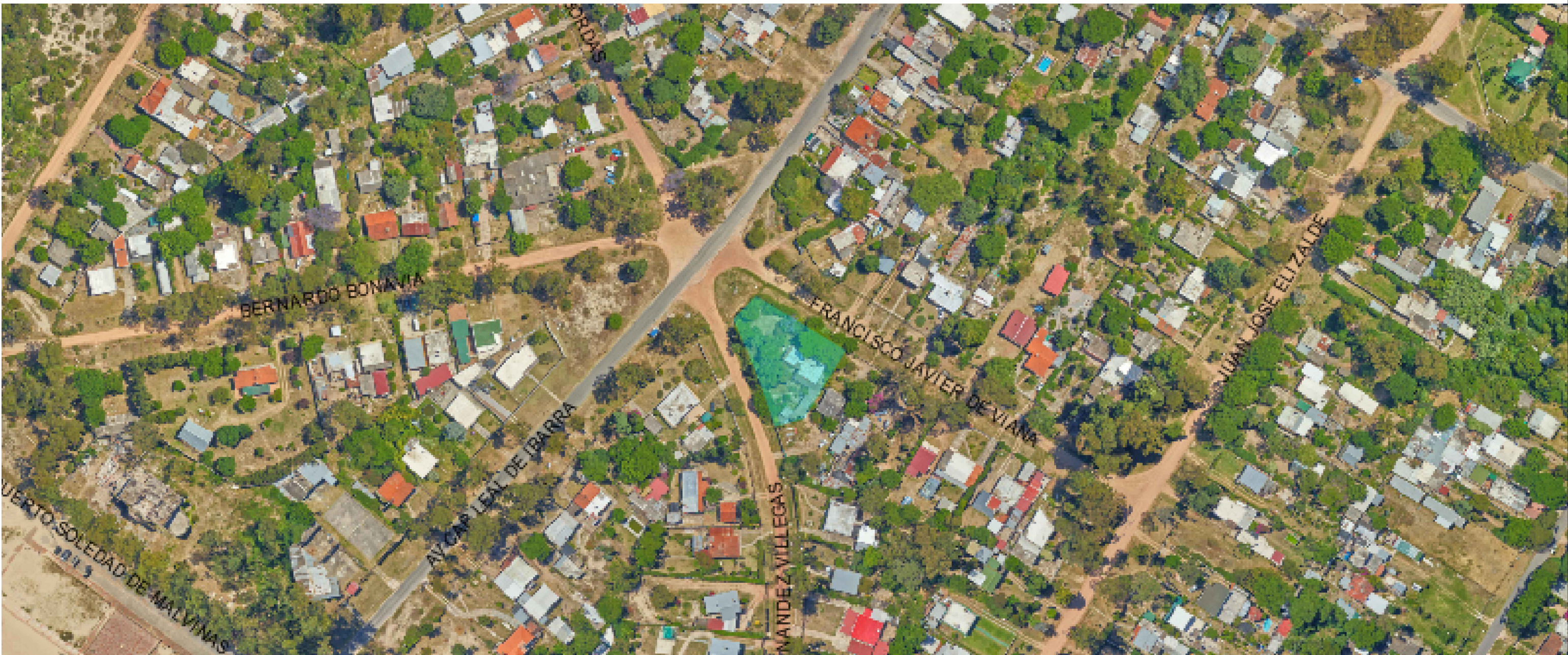
PLANTA UBICACION esc 1:1250