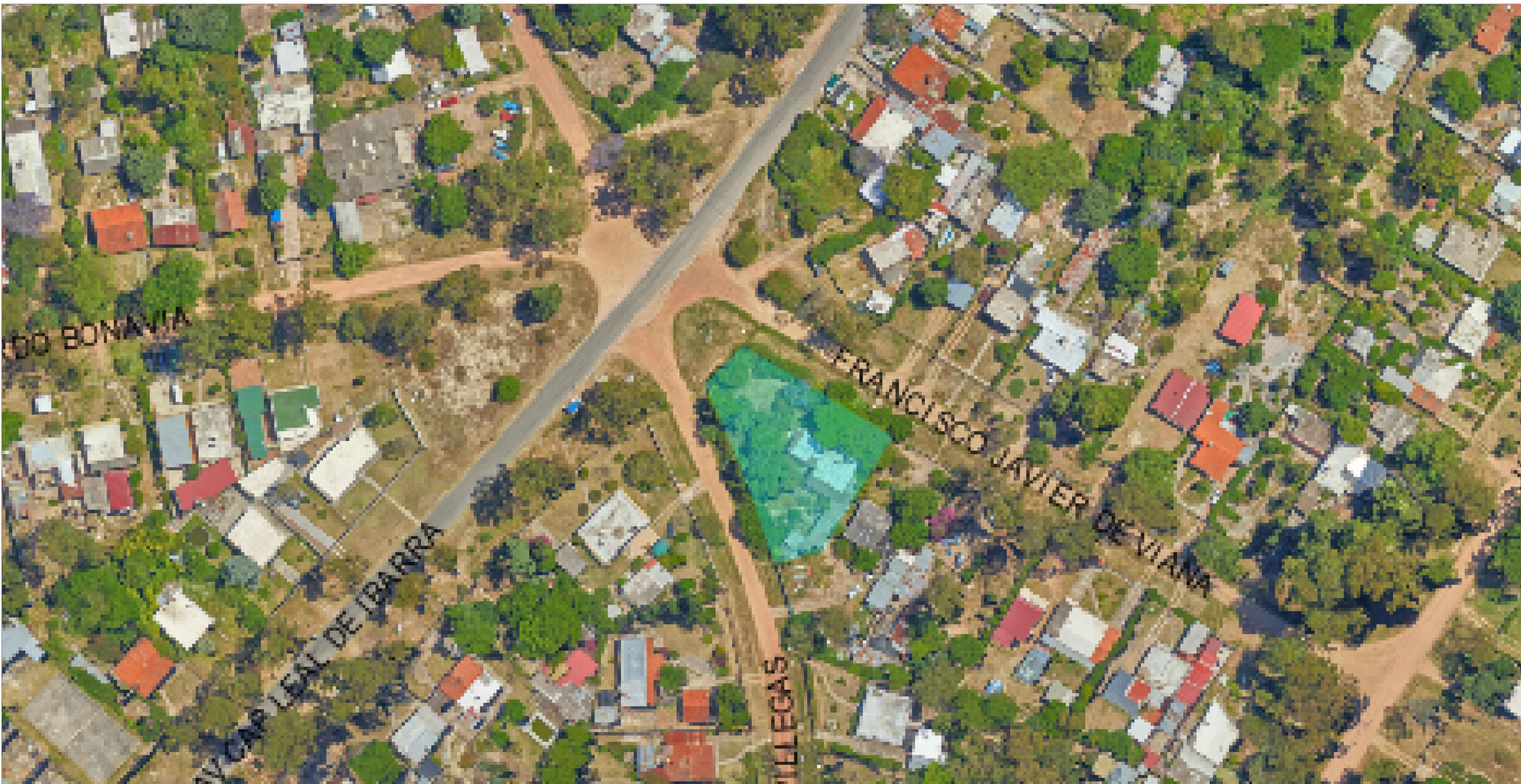
PLANTA UBICACION esc 1:750