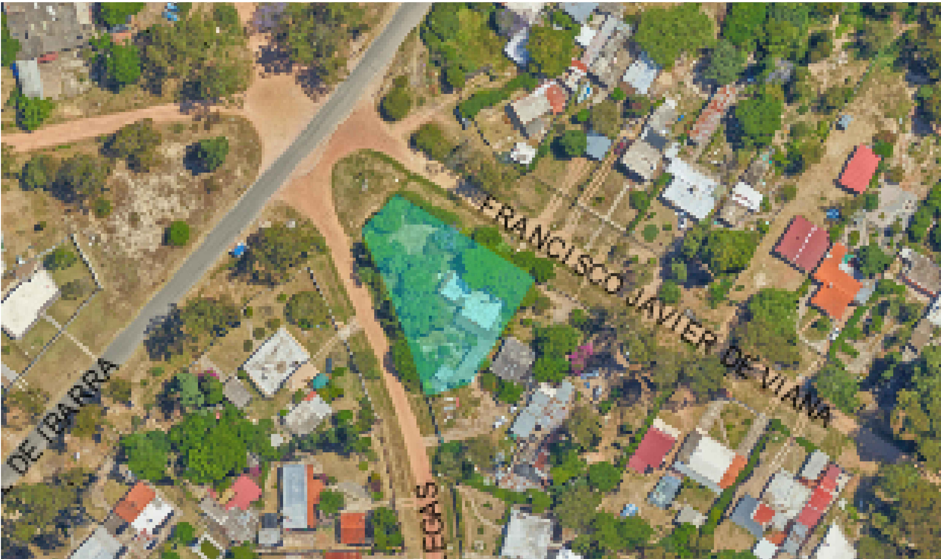
PLANTA UBICACIONesc. 1:500